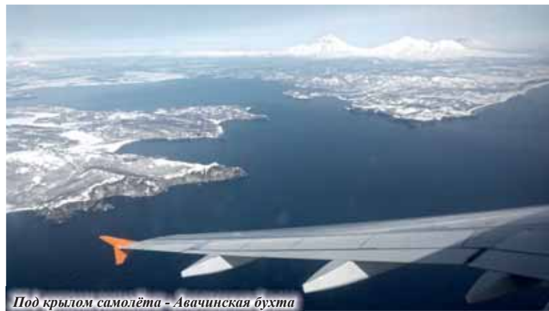
Под крылом самолёта - Авачинская бухта

Кстати, удивительное дело - самая большая сеть супермаркетов в Петропавловске-Камчатском называется «Шаверма», а не менее распространённая сеть алкомаркетов - «Пробочка». Есть над чем задуматься, не правда ли?