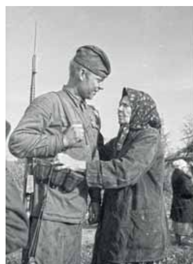
P.S.: Героический труд 2908 горняков, металлургов, обогатителей комбината «Сихали» отмечен медалями «За доблестный труд в Великой Отечественной войне 1941-1945 г.г.»

Итак, период Великой Отечественной войны - это яркая страница истории нашего Дальнегорского района, поскольку именно с 1941-го по 1945 год во всей полноте проявились высокие моральные качества и патриотизм тетюхинцев. Много минуло лет после окончания войны, но никогда не померкнет подвиг тех, кто ковал Победу в тылу.