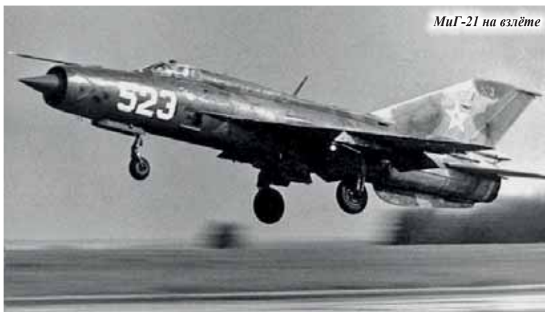
МиГ-21 на взлёте