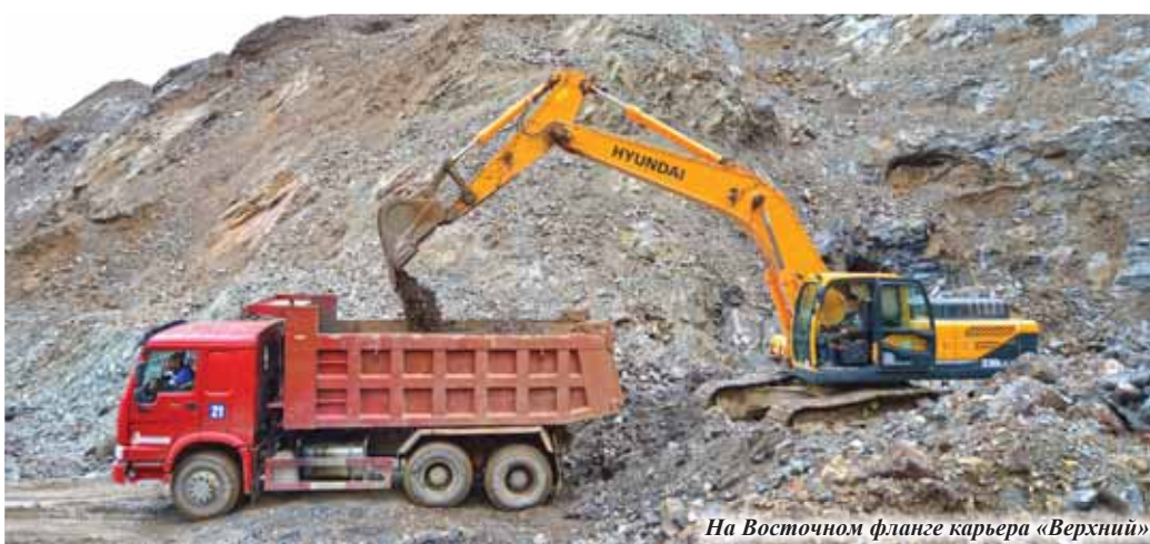
На Восточном фланге карьера «Верхний»

Рудник «Верхний» - старейший в структуре ГМК «Дальполиметалл». Освоение одноимённого месторождения началось ещё в позапрошлом веке. До революции и в первые годы советской власти оно вскрывалось штольневными горизонтами, затем - стволами и шахтными горизонтами. Несколько лет назад век подземной отработки рудника «Верхний» завершился, но месторождение продолжает эксплуатироваться участком открытых горных работ.