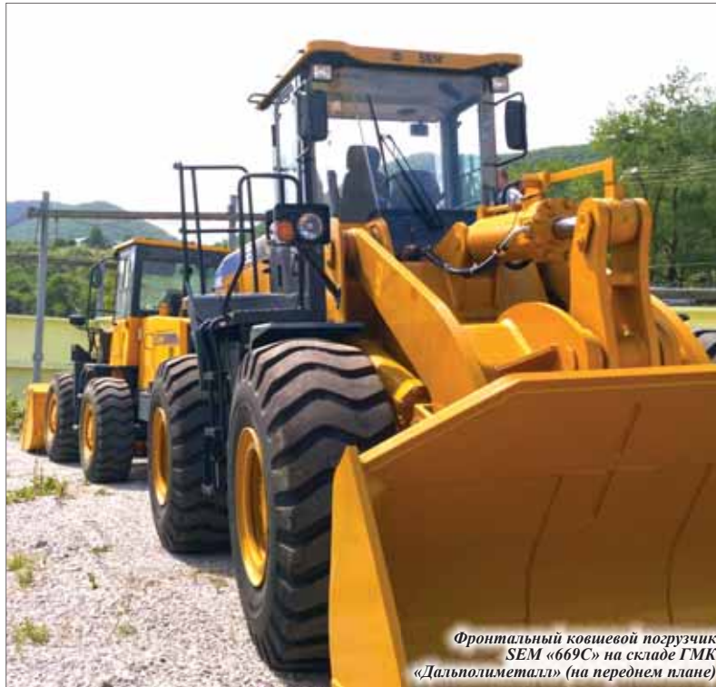
Фронтальный ковшевой погрузчик SEM «669С» на складе ГМК «Дальполиметалл» (на переднем плане)

SEM «669С» относится к другому классу машин. Его грузоподъёмность - 6 тонн, объём ковша - 3,5 куб. м. Примечательно, что в феврале 2008 года компания SEM вошла в структуру корпорации Caterpillar. Кстати, колёсные погрузчики SEM серии 600 - это совместный с Caterpillar проект нового поколения тяжёлых ковшевых машин, предназначенных для работы с твёрдыми скальными породами. Поэтому погрузчик «669С» оснащён не только трансмиссией CAT, но и усиленными мостами известного производителя горной техники. На рудном отвале ЦОФ, где будет работать SEM «669С», высокие эксплуатационные характеристики этому погрузчику пригодятся особенно зимой, когда горная масса смерзается.