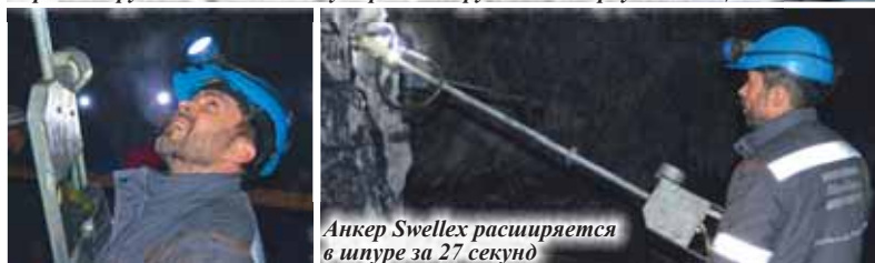
Анкер Swellex расширяется в шпуре за 27 секунду

щина стенки анкера - 2-3 мм. Когда анкер Swellex принимает напряжённое состояние, мгновенно создаётся противодействие горному давлению, что значительно повышает безопасность ведения горных