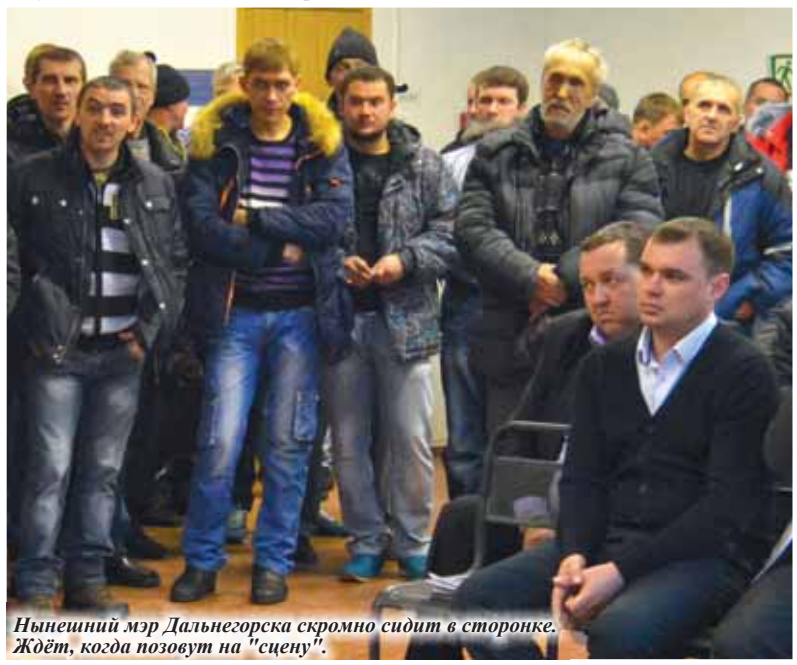
Нынешний мэр Дальнегорска скромно сидит в сторонке. Ждёт, когда позовут на "сцену".