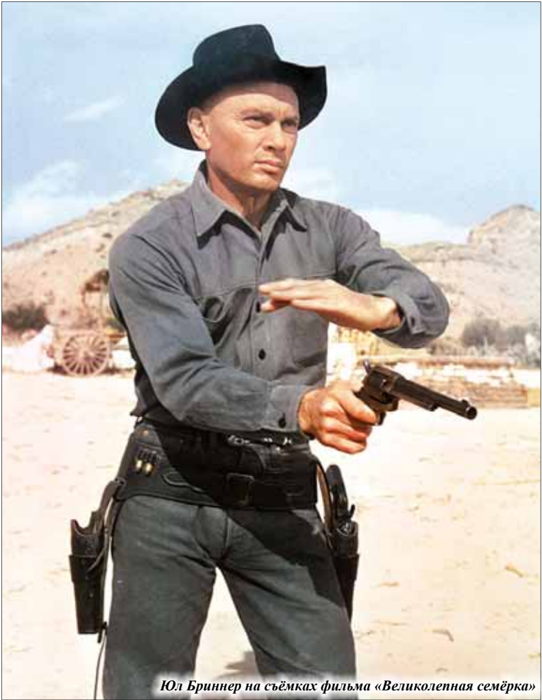
Юл Бринер на съёмках фильма «Великолепная семёрка»

Продолжение читайте в следующем выпуске газеты