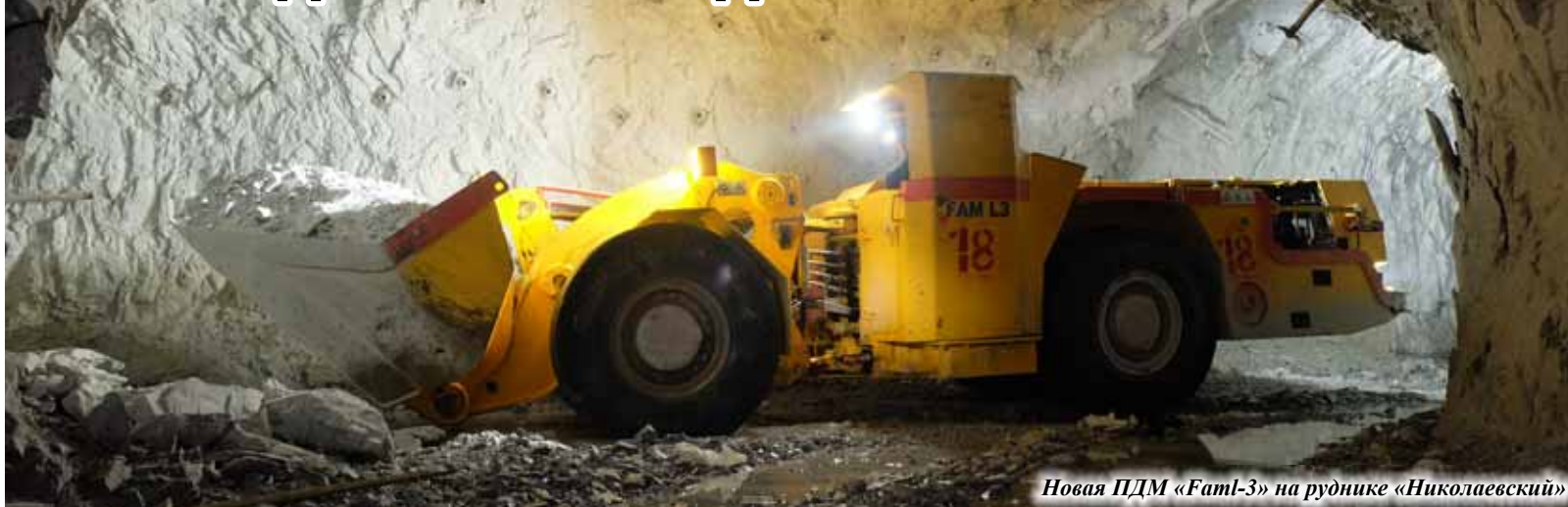
Новая ПДМ «Famt-3» на руднике «Николаевский»

Технологи знают, что февраль, в котором всего-то 28 дней, – не самый подходящий месяц для рекордов. Однако именно в феврале рудники ГМК «Дальполиметалл» и обогатительная фабрика показали лучший результат работы за последние пять лет (в аналогичном периоде). Даже рудник «Николаевский» в последнем зимнем месяце достиг 101% по суммарному металлу в добытой руде. Наивысших же показателей по суммарному металлу удалось добиться коллективу рудника «Верхний». В основном, конечно, за счёт участка открытых горных работ – 124,4%.