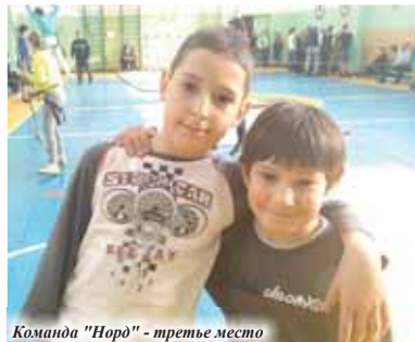
Команда "Норд" - третье место