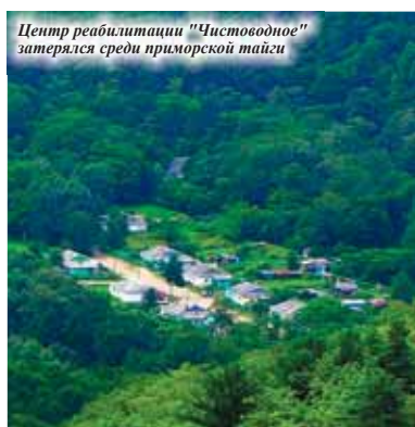
Центр реабилитации "Чистоводное" затерялся среди приморской тайги

Показания для направления в ЦР «Чистоводное» следующие: кожные заболевания, остеохондроз всех отделов позвоночника, артрозы и артриты, эндартерииты, трофическая язва, гинекологические заболевания, бесплодие, спаечный процесс органов малого таза. Запись на лечение в ЦР «Чистоводное» осуществляется по направлению лечащих врачей в Дальнегорской центральной городской поликлинике - в каб. № 32 с 13:00 до 15:00. При себе необходимо иметь: паспорт, полис ОМС, СНИЛС, направление от врача.