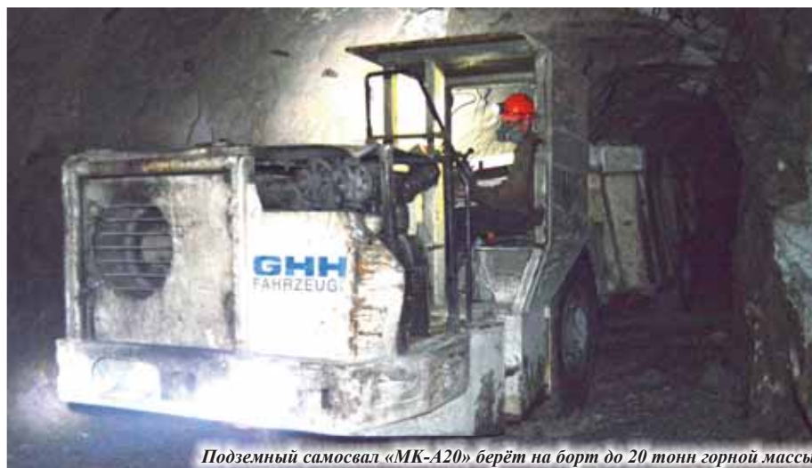
Подземный самосвал «МК-А20» берёт на борт до 20 тонн горной массы

В горном деле так устроено - добывая руду, думай о том, как прирастить запасы. Николаевское месторождение эксплуатируется больше 30 лет, и с каждым годом горняки «Николаевки» спускаются за рудой всё ближе к нижнему откаточному горизонту - на отметку -420 метров. Возникает резонный вопрос: «Что дальше?»