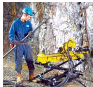
Справка: ThyssenKrupp Mannex GmbH - это международная торговая компания, являющаяся частью промышленного концерна ThyssenKrupp AG. На протяжении многих лет компания поставляет по всему миру трубы, фитинги, стальной прокат, оборудование для нефтепереработки, производства энергии и т.д.

Отметим, что для «Дальполиметалла» станок колонкового бурения Diames-232 - отличное приобретение. Знающие геологи хвалят этот станок за качественнейший выход керна, а бурильщики - за высокую производительность и малый расход коронок. С приходом на рудника «Диамека» буровой участок значительно увеличивает свои показатели по бурению геологоразведочных скважин.