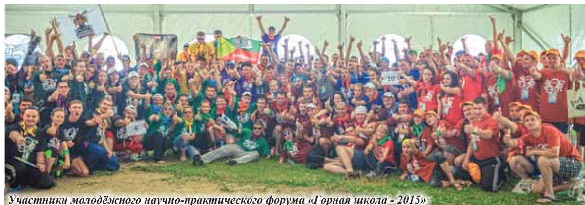
Участники молодёжного научно-практического форума «Горная школа - 2015»

Победители научно-практического форума «Горная школа-2015» пройдут обучение по президентской программе на условиях софинансирования в размере 1 млн рублей с последующей зарубежной стажировкой в Японии.