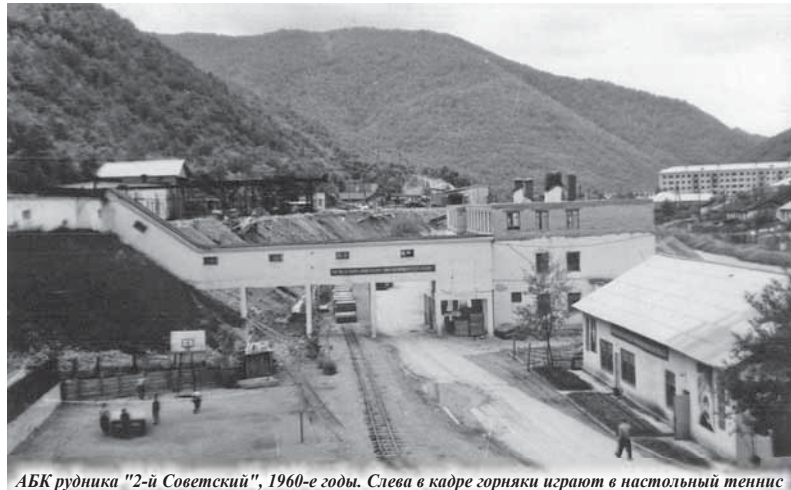
АБК рудника "2-й Советский", 1960-е годы. Слева в кадре горняки играют в настольный теннис