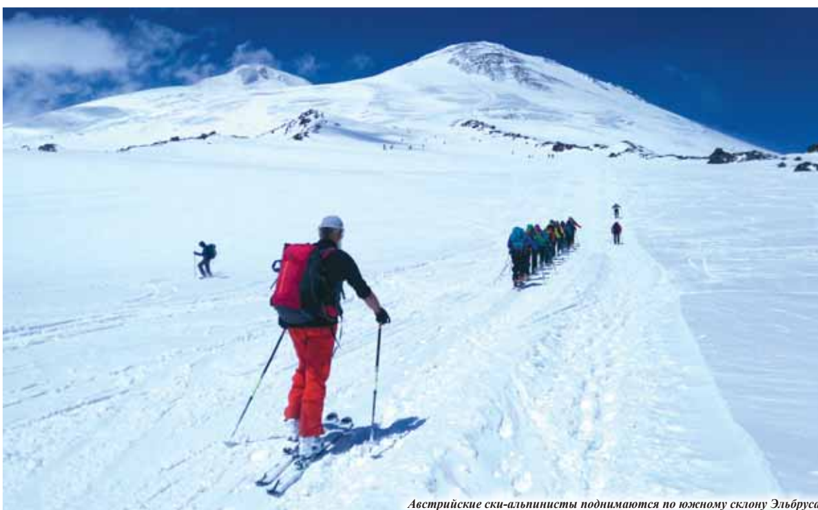
Австрийские ски-альпинисты поднимаются по южному склону Эльбруса

бору снаряжения. В подтверждение сказанному один из десятков трагических случаев: в мае 2006 года на седловине насмерть замёрзла целая группа - 11 человек! Умирают на высоте и от переутомления. Был свидетелем - неподалёку от скал Пастухова ушёл в мир иной некий швейцарец, которому, говорят, не было ещё и сорока. Просто не выдержало сердце.