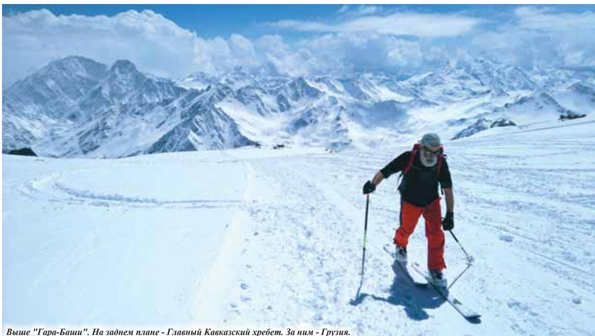
Выше "Гара-Баши". На заднем плане - Главный Кавказский хребет. За ним - Грузия.

Эльбрус, кстати, не щадит людей и в мирное время - ежегодно забирает 20-25 жизней. Погибают, в основном, туристы неопытные, легкомысленно относящиеся к горам и к вы-