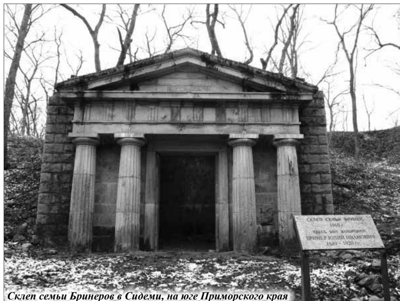
Склеп семьи Бринеров в Сидеми, на юге Приморского края