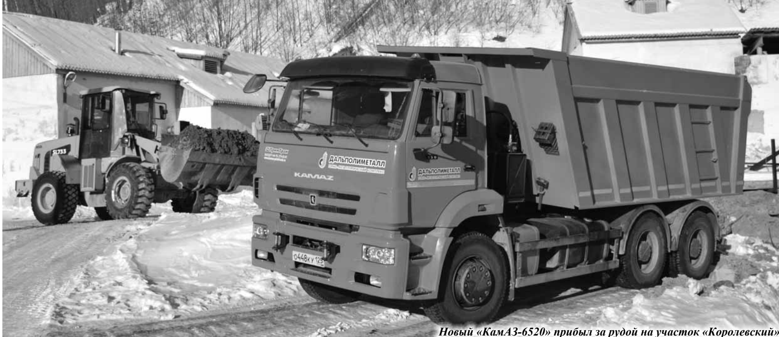
Новый «КамАЗ-6520» прибыл за рудой на участок «Королевский»

В разгар новогодних праздников парк грузовых автомобилей транспортного цеха ГМК «Дальполиметалл» пополнился новым самосвалом «КамАЗ-6520». Третьего января машину отправили в первый рейс за рудой.