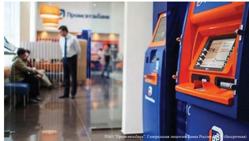
ПАО «Промсвязьбанк». Генеральная лицензия Банка России №22 (бессрочная)

Отметим, что зарплатный проект «Промсвязьбанка» включает в себя более 30 000 организаций и обслуживает порядка 1 500 000 зарплатных карт. «ПСБ» осуществляет приём и обслуживание карт международных платёжных систем Visa International, Mastercard World Wide, а также национальной платёжной системы «Мир» в банкомат-