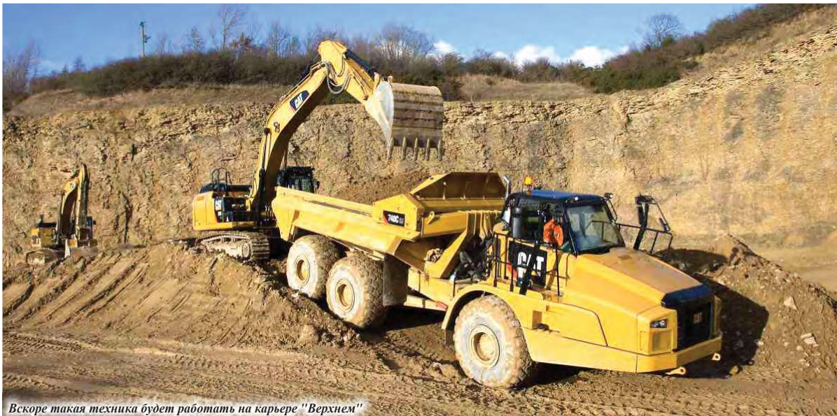
Вскоре такая техника будет работать на карьере «Верхнем»