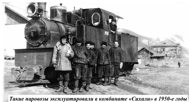
Такие паровозы эксплуатировали в комбинате «Сихали» в 1950-е годы