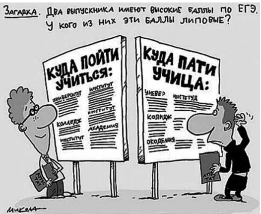
Загадка. Два выпускника имеют высокие баллы по ЕГЭ. У кого из них эти баллы липовые?

В магазинах, где продают или шьют шторы, часто можно услышать что-нибудь про «красивую тюль». На самом деле «тюль» - мужского рода: «гардинный тюль». Кстати, в языке-источнике (французском) это существительное тоже мужского рода.