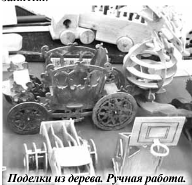
Подделки из дерева. Ручная работа.