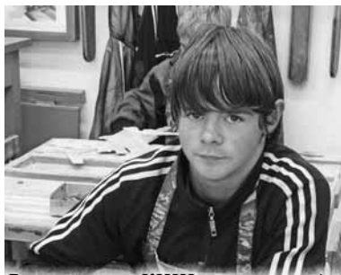
Воспитанник КШИ на уроке труда

- Очень важно, чтобы дети научились мастерить руками, ов-