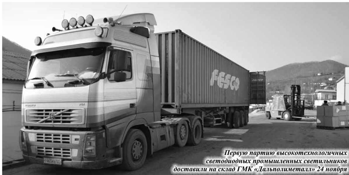
Первую партию высокотехнологичных светодиодных промышленных светильников доставили на склад ГМК «Дальполиметалл» 24 ноября

Гарантированный срок горения светодиодных светильников поражает – 30 тыс. часов! Но экономическая эффективность достигается не только за счёт надёжности и продолжительной эксплуатации – в сравнении с аналогичными газоразрядны-