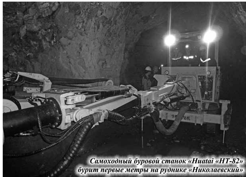
Самоходный буровой станок «Huatai «НТ-82» бурит первые метры на руднике «Николаевский»

Отметим, что технологии анкерного крепления подземных горных выработок стремительно развиваются. Поэтому в ГМК «Дальполиметалл» отслеживают новейшие тенденции в горнодобывающей промышленности мира и, по возможности, стремятся внедрять современные методы ведения работ на своём производстве, в том числе, за счёт планомерного технического переоснащения.