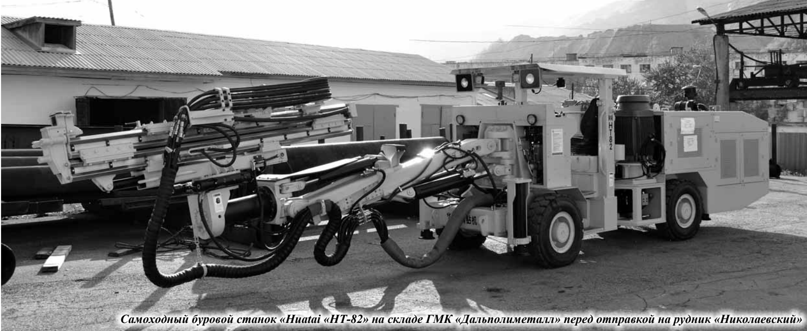
Самоходный буровой станок «Huatai «NT-82» на складе ГК «Дальполиметалл» перед отправкой на рудник «Николаевский»

В ГК «Дальполиметалл» продолжаются поставки новой горной техники. Если в предыдущий месяц горняки на рудниках предприятия получили канадский подземный самосвал «DUX «DT-7» и тяжёлый бульдозер «Zoomlion «Z 320-3», то одним из последних приобретений дальнегорского градообразующего предприятия стал самоходный буровой станок «Huatai «NT-82».