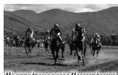
На ипподроме в селе Новогордеевка

Интересно, что по давней традиции дамы на скачках по-