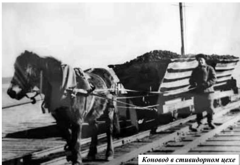
Коновод в стивидорном цехе