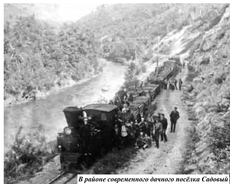
В районе современного дачного посёлка Садовый

Но вернёмся к железной дороге. Её строительство началось в 1908 году. Узкоколейку прокладывали в глухой тайге среди вековых кедровых исполинов. К 1909 году на пирсе в стивидорном отделении установили паровой кран «Крафтон» грузоподъёмностью 1,5 тонны. В бухте Тетюхе для железнодорожной ветки