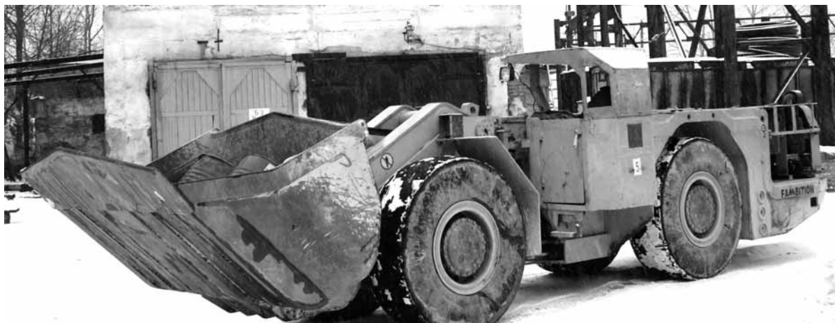
ПДМ «Fam1-3» на промплощадке рудника «2-й Советский»

Став частью парка самоходной техники рудника, погрузочно-доставочная машина «Fam1-3» значительно увеличила возможности добычного участка №2. Теперь новая ПДМ применяется как на добыче руды, так и на уборке горной массы с проходки Транспортного уклона - стратегической подземной выработки «2-го Советского». Напомним, уже в недалёком будущем с помощью этой выработки горняки вскроют объёмную рудную залежь, где, по оценкам геологов, сосредоточены огромные запасы руды - порядка 1 млн. тонн.