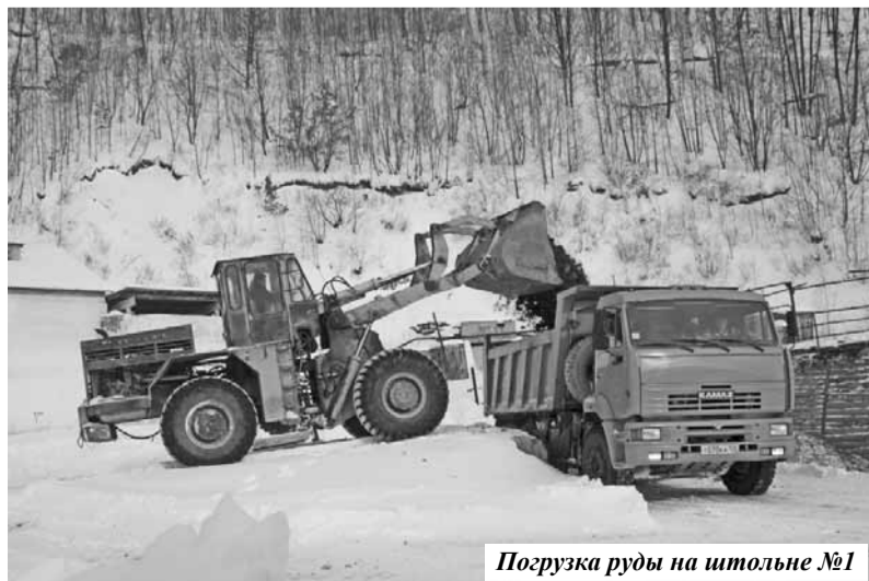
Погрузка руды на штольне №1