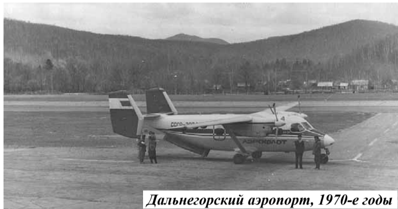
Дальнегорский аэропорт, 1970-е годы

Накануне почти все краевые СМИ объявили о том, что в Приморье планируется построить 30 новых аэропортов, а поток пассажиров на местных авиалиниях увеличить в 10 раз – с 8 до 83 тысяч человек в год.