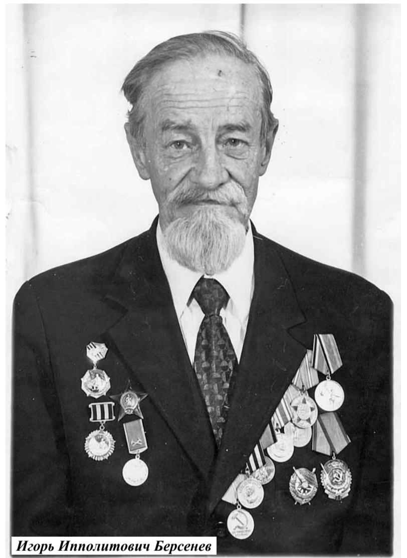
Игорь Ипполитович Берсенева

ления Федеральной службы государственной регистрации, кадастра и картографии и в память об исследователе геологии дна Японского моря геологе Игоре Ипполитовиче Берсенева присвоить наименование безымянному подводному хребту, расположенному в Японском море, назвав его «хребет Берсенева». Координаты северной оконечности хребта - 42°13,3' северной