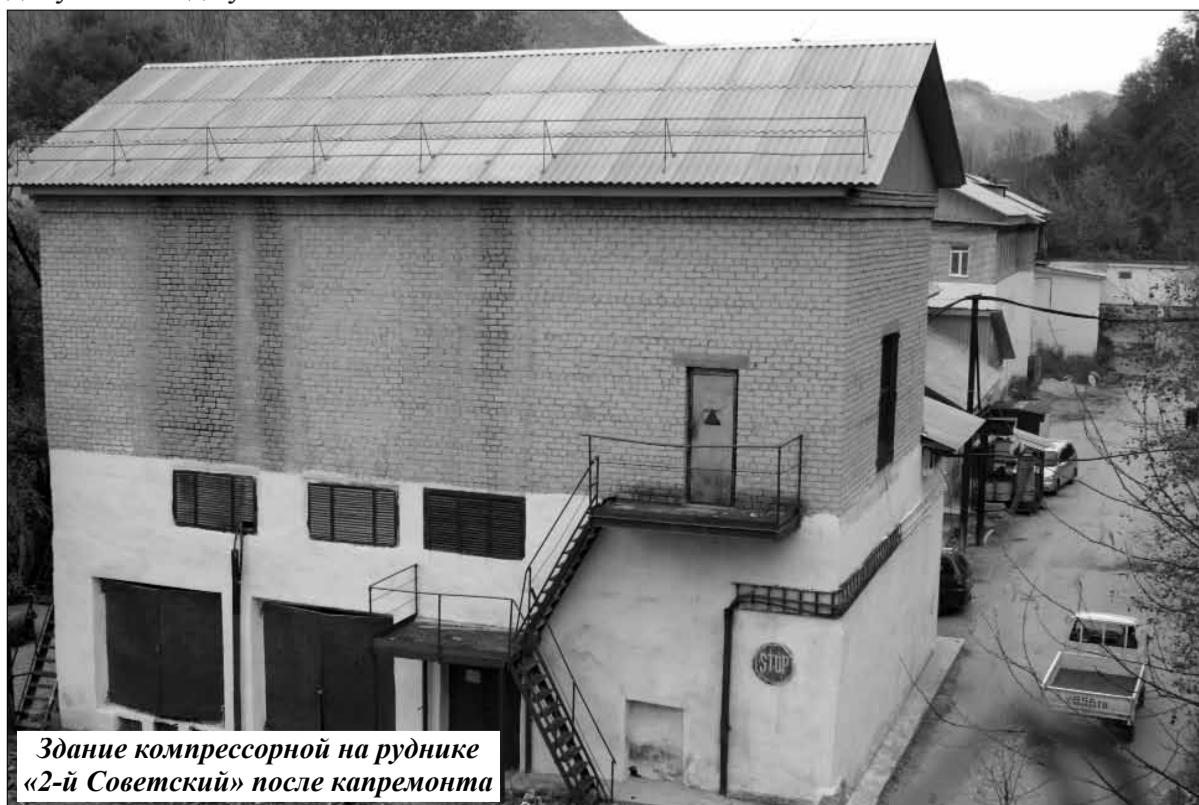
Здание компрессорной на руднике «2-й Советский» после капремонта